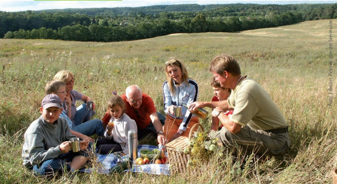
Picknick über der Seennulde