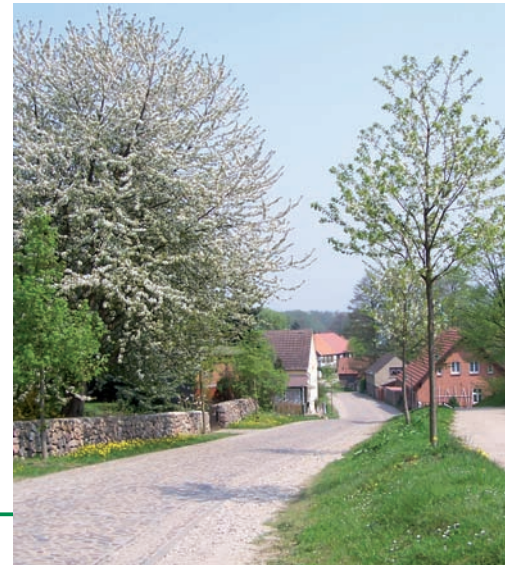
Ortsdurchfahrt Carwitz