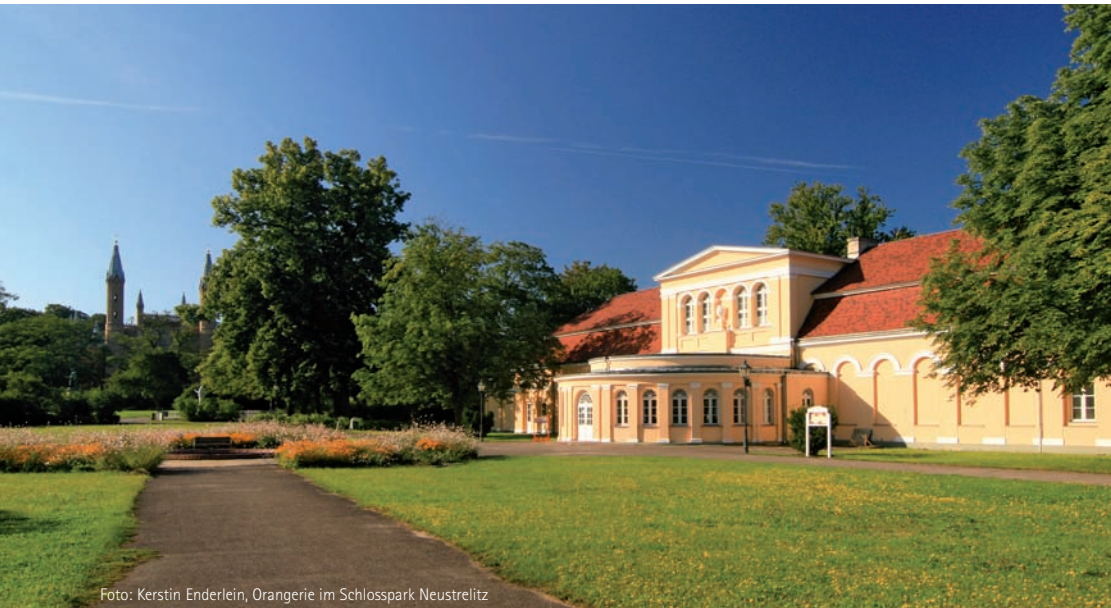
Orangerie im Schlosspark Neustrelitz

Entspannen Sie im Tiergarten oder nutzen Sie die Kreativangebote des Slawendorfes. Genießen Sie die reizvolle Natur im Stadtgebiet selbst, im angrenzenden Müritz-Nationalpark und in der Neustrelitzer Seenvielzahl beim Wandern, Radeln oder Boot fahren.