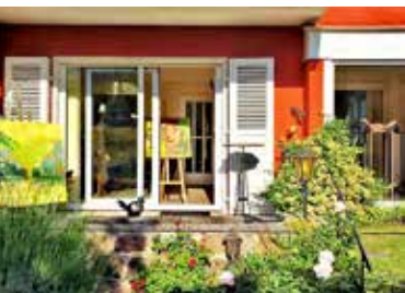
Petite Galerie Beatrice