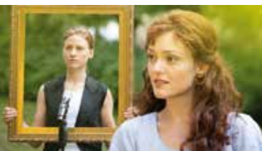
Stolz und Vorurteil