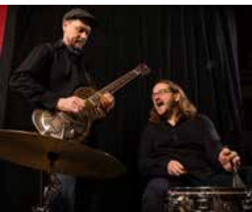
„NOLA“, Foto: Wolfgang Borrs