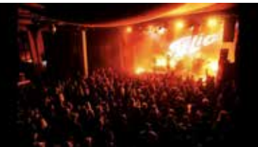
(Das Publikum war begeistert beim Konzert der Band Selig beim Studio am See-Festival 2022)