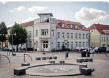
Malchow, Haus des Gastes „Werleburg“

Wann: täglich, 10 – 17 Uhr (Mai bis Oktober), November bis Dezember: Sa./So. geöffnet