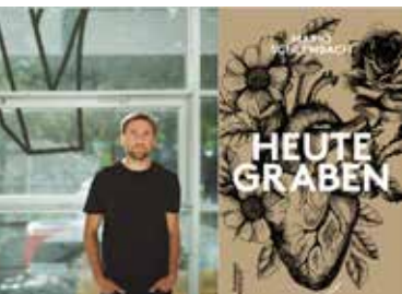
Verlag Kremayr & Scheriau