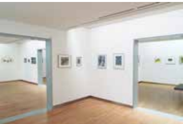
Blick in die Räume der Ausstellung meiNIBild 2022