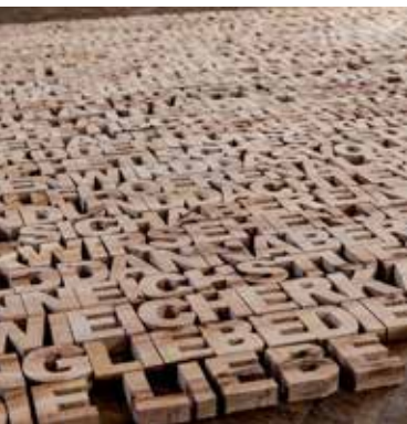
DAS HOHELIED DER LIEBE I. Korinther 13