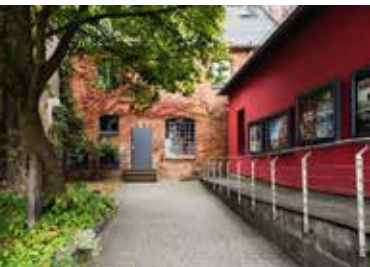
Innenhof der Alten Kachelofenfabrik