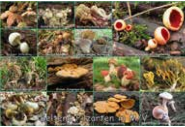
Collage Pilzarten in M-V