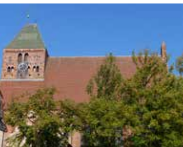
St. Marien-Kirche Penzlin