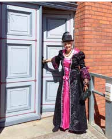
Prinzessin Mathilde am Rathaus

altentreptow@pek.de, www.evangelisch-im-tollensewinkel.de