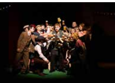
Hopfen und Malz, Operette von Daniel Behle: © TOG/ Theresa Lange