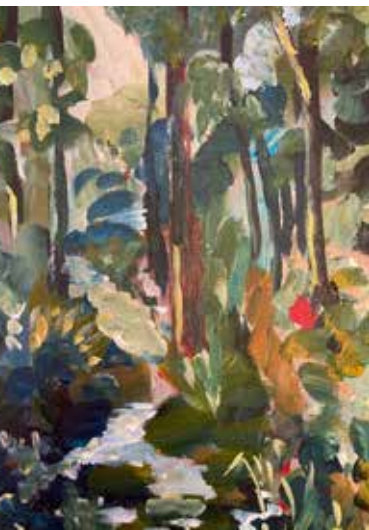
Lenné-Park in Göhren