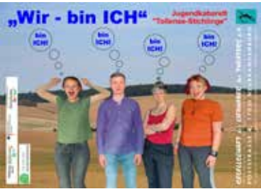
Plakat Tollense-Stichlinge, Programm: „Wir - bin ICH“