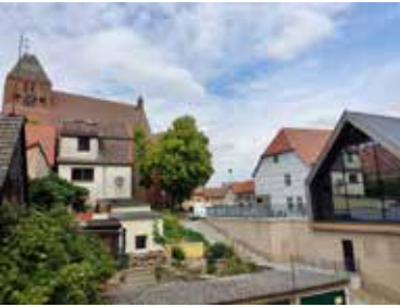
Start der Schnitzeljagd ist die Alte Burg Penzlin