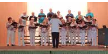
Müritzchor im Kursaal 2022