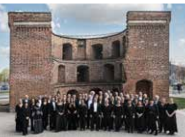
Neubrandenburger Philharmonie: © TOG/ Jörg Metzner