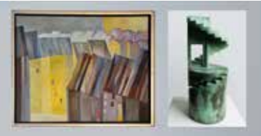
J. Lautenschläger: „Häuserlandschaft“, Acryl/ LW, R. Fest: „Wendepunkt“, Bronze, Kunsthhaus Koldenhof

Kontakt: info@kunsthhaus-koldenhof.de www.kunsthhaus-koldenhof.de