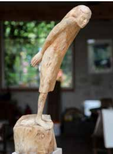
Auf dem Weg