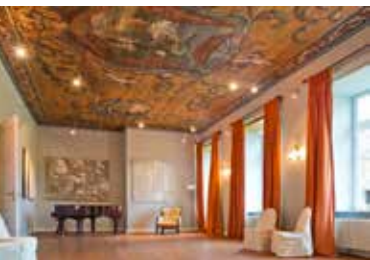
Gutshaus Ludorf, Barocksaal