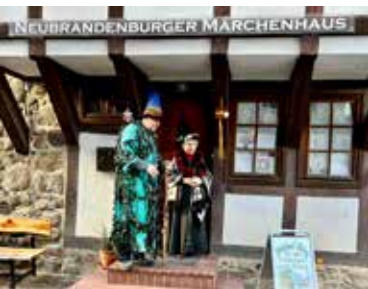
Märchenprojekt für Schulklassen