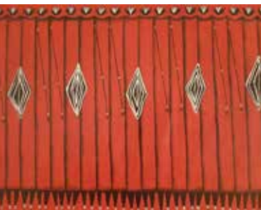
Maasai – abstrakt

Im Zeitraum vom 09.09.2023 bis 20.09.2023, jeweils 14 – 18 Uhr.