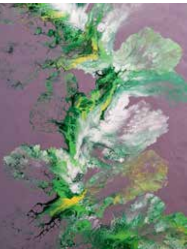
Der Frühling kommt wieder