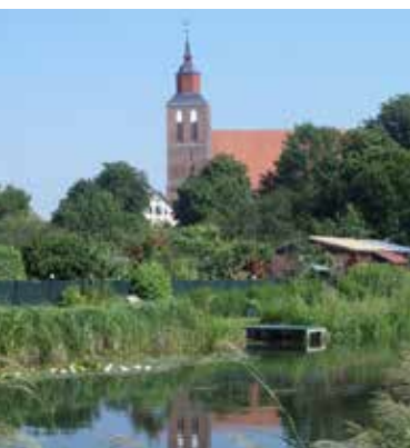
St. Petri Altentreptow

Wann: Sonntag, 10.09.2023, 10:00 – 16:30 Uhr