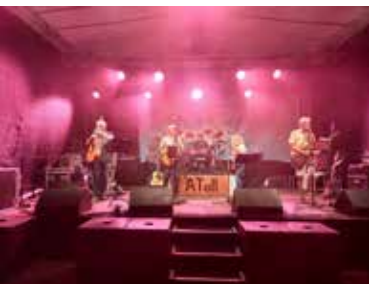
Band ATOLL, © Ricarda Heibel, Stadt Altentreptow